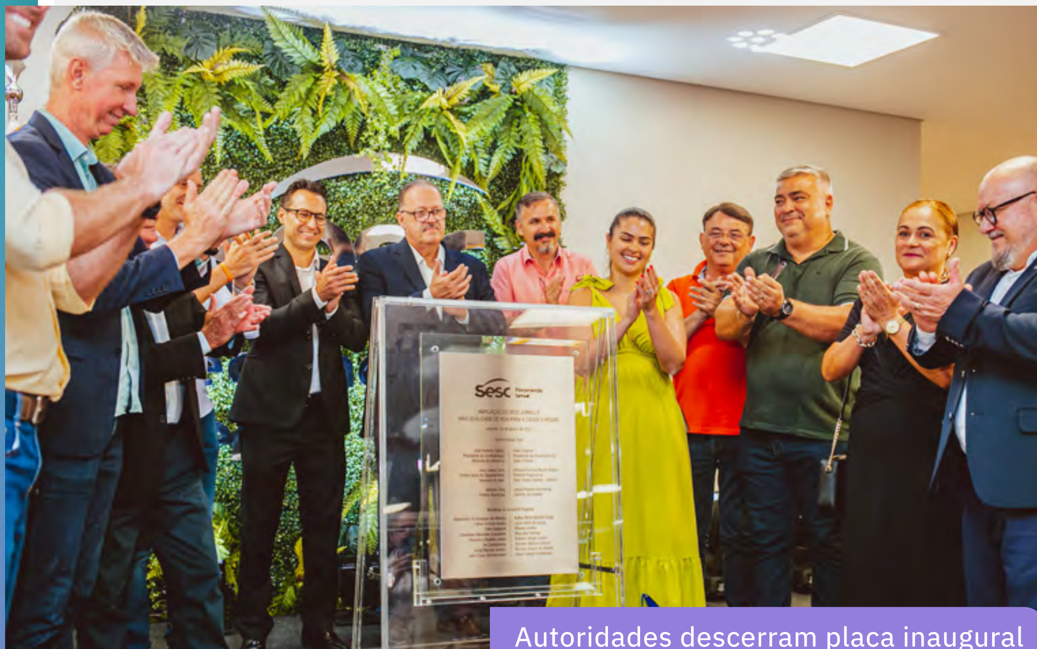
Autoridades descerram placa inaugural

Durante a inauguração do novo bloco foram anunciados novos investimentos para a região.